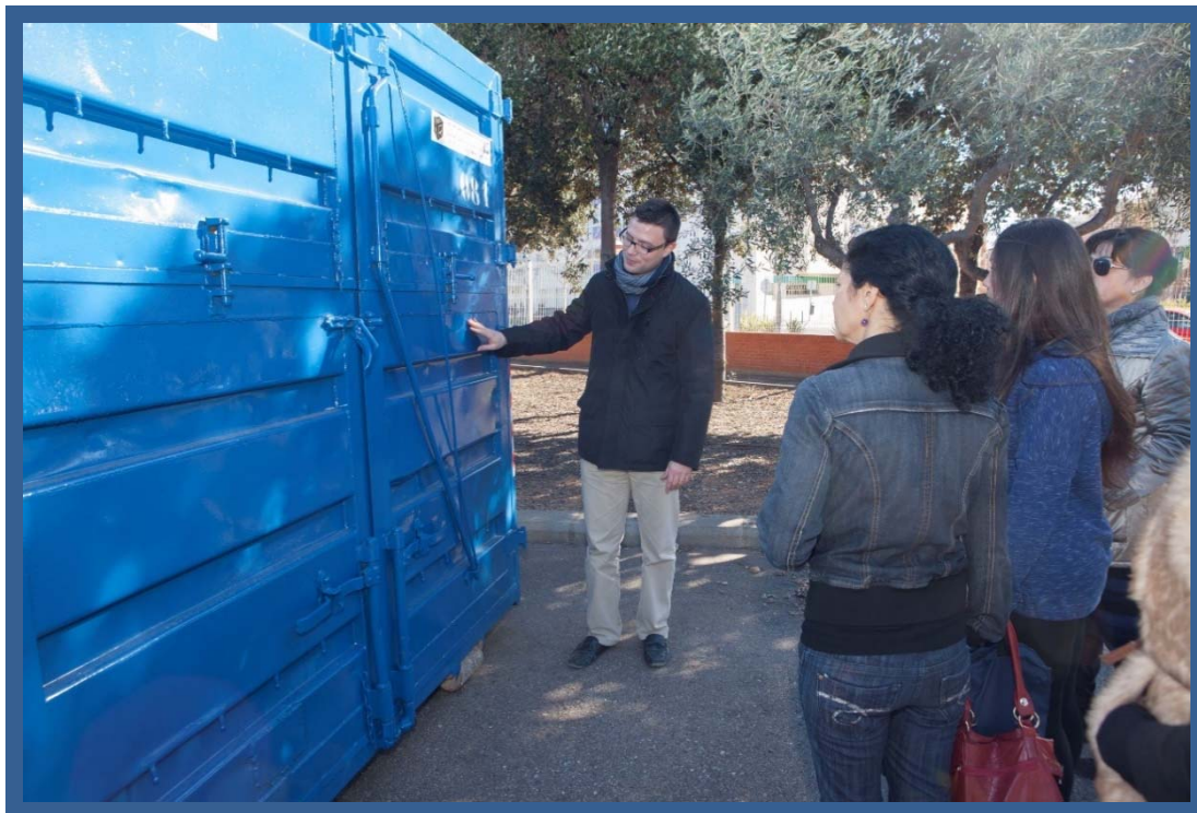
Voluntàries que assisteixen a formació específica sobre reciclatge.