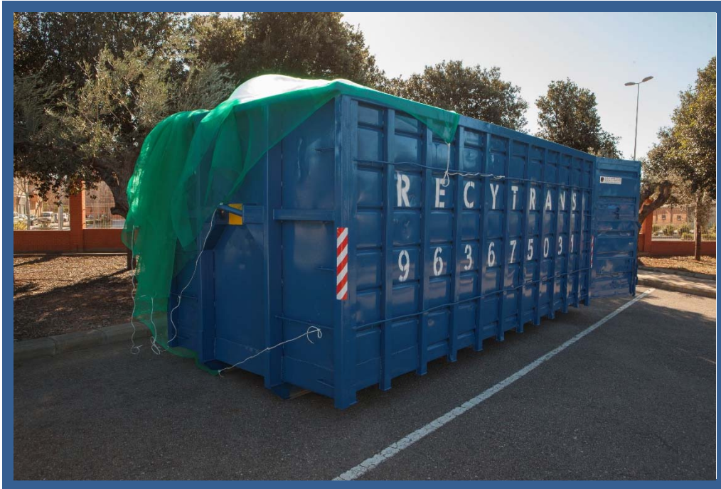
Contenedor de reciclaje situado en la zona sud de l'UJI.