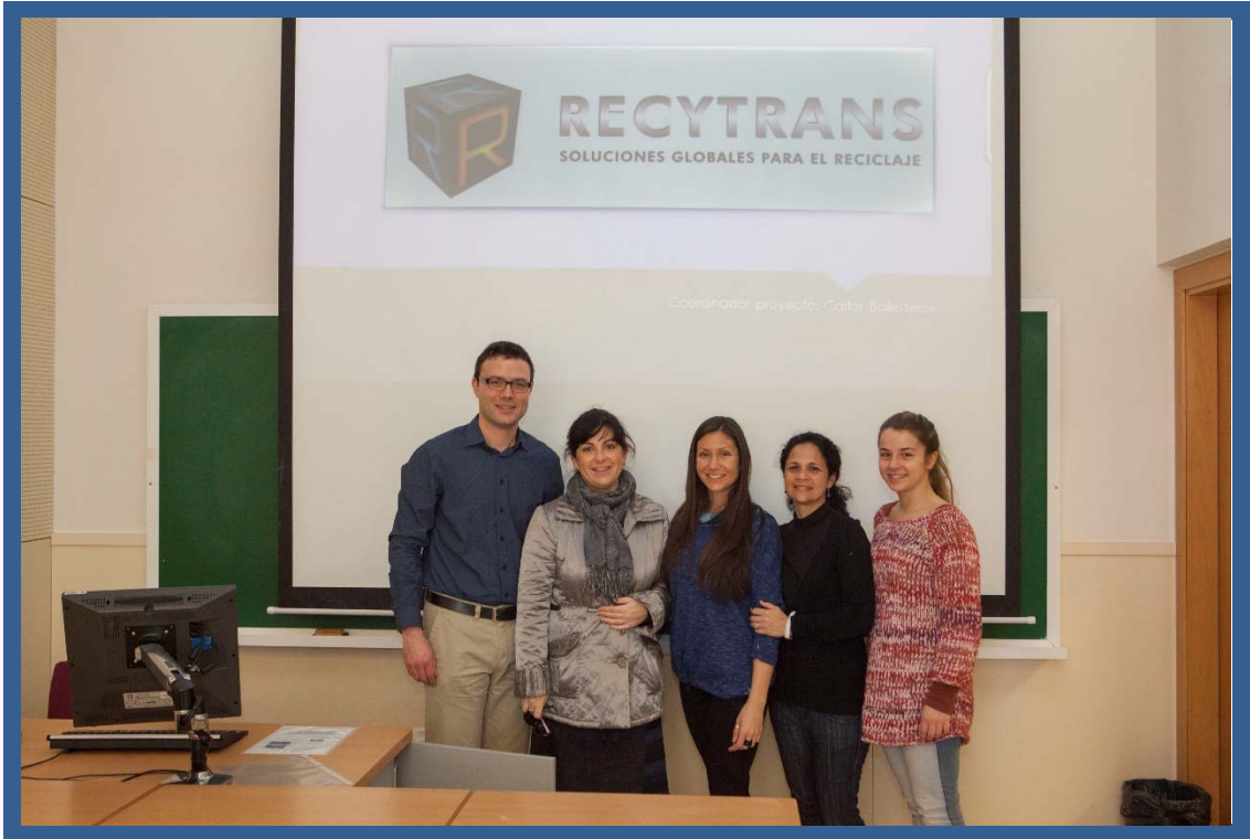
Acte d'inauguració del curs de formació específica sobre reciclatge.