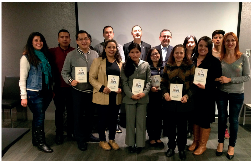
Primer Club AlumniSAUJI Internacional en Colombia