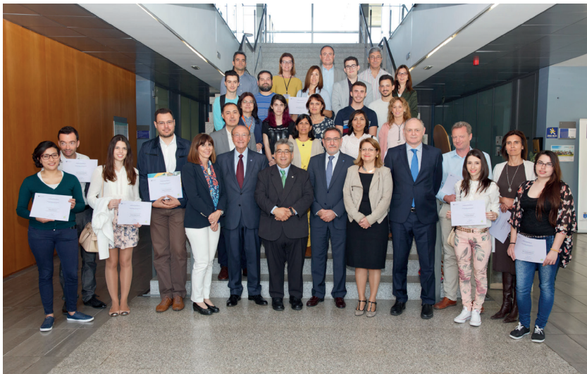
Embajadoras y embajadores de la Universitat Jaume I