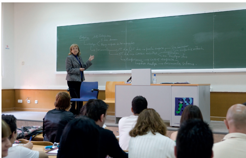
Innovación y mejora docente

En cuanto a nuestro compromiso con la calidad de la docencia, se han organizado 42 cursos de formación del profesorado, con 491 asistentes; y en cuanto a la formación del profesorado novel, se han formado 62 personas.