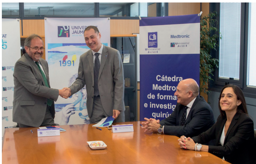
Convenio Cátedra Medtronic de Formación e Investigación Quirúrgica

En cuanto a las cuestiones institucionales, además de los aproximados 100 convenios formalizados con instituciones y universidades de todo el mundo, hay que señalar que, en el marco de nuestro Programa de patrocinio y mecenazgo, se han firmado 81 convenios con entidades externas, entre las cuales hay que destacar los acuerdos para poner en marcha la Cátedra Reciplasa de