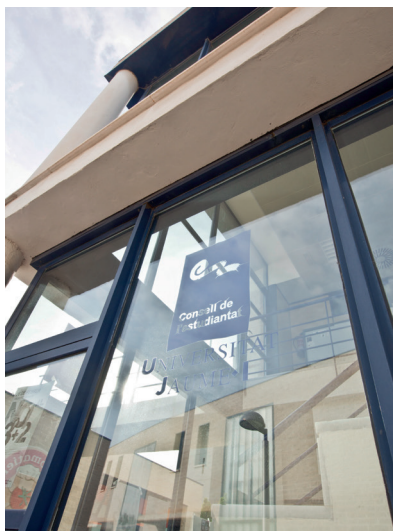
Renovación del Consell de l'Estudiantat