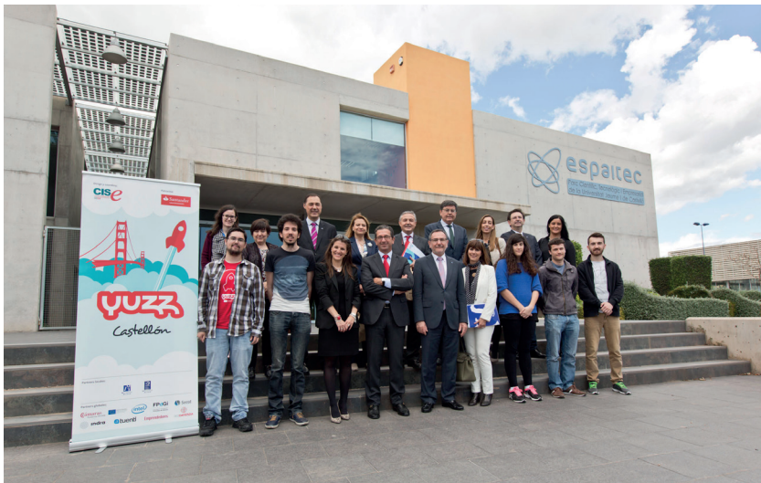
Becas Santander CRUE CEPYME

Por su parte, la Cátedra INCREA ha continuado con la promoción de la creatividad, la innovación y la emprendeduría con varias acciones, programas y actividades.