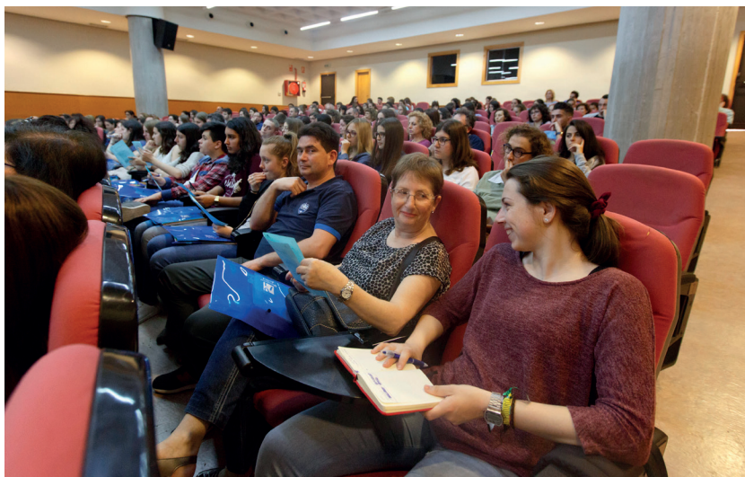
I Jornada de Puertas Abiertas: en Familia

Dentro de las actividades de orientación universitaria, se han consolidado y mejorado las numerosas iniciativas que empezaron los cursos anteriores. Se tiene que destacar la realización de la I Jornada de Puertas Abiertas: en Familia , dirigida a padres, madres y alumnado de segundo ciclo de ESO, bachillerato y ciclos formativos de grado superior, así como la I Jornada Estudia e Investiga a la UJI , que permite a los alumnos colaborar con grupos de investigación desde los primeros cursos de universidad.