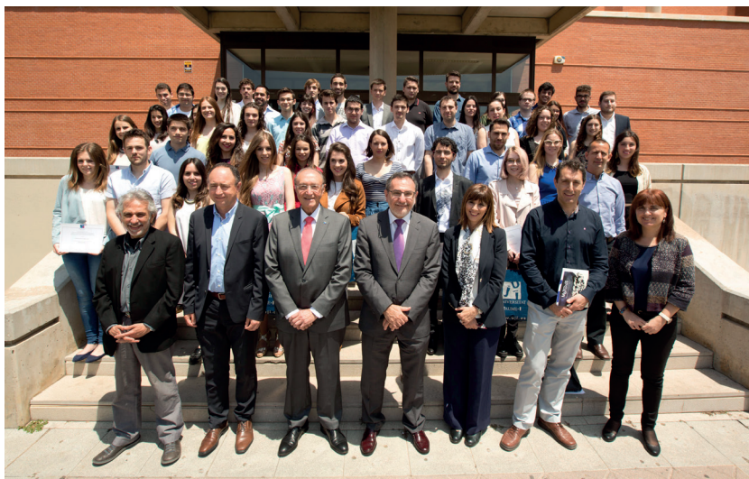
92 Premis a la Excelencia Académica

En cuanto a los estudiantes con necesidades educativas especiales, dentro del Programa de atención a la diversidad hemos trabajado con 290 estudiantes y 663 personas entre PAS y PDI.